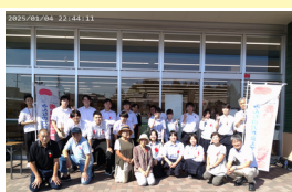
社会福祉協議会の方と写真撮影