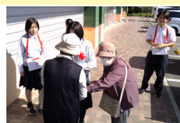
沢山の町民の方が募金してくれました