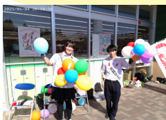
小さなお子さんに風船も配りました！