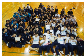
最後は全校生徒＆先生で記念撮影