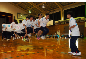
跳躍が高い！（長縄跳びの様子）