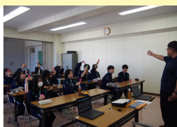
防災士からの質問に積極的に答えていました