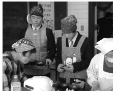
食堂のお手伝いも体験しました