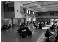
1年生も2年生も自分の進路に真剣な表情でした