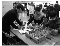
昔のおもちゃから沢山のつながりができました