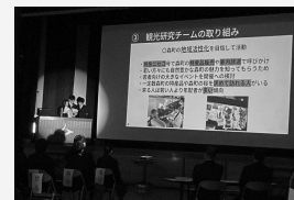
森高校発表の様子

他の学校の発表も沢山聞くことができ、発表スライドの作り方や内容がわかりやすく、聞いていて新鮮だったし、森高校では取り上げていないテーマも多く、学ぶことの多い発表会だった。とても疲れたけれど良い経験になった。この経験を今後の学校生活にさらに生かしていきたい。