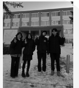
終了後、会場前にて