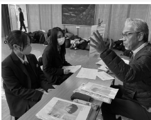
担当者の方も熱心に説明してくれました