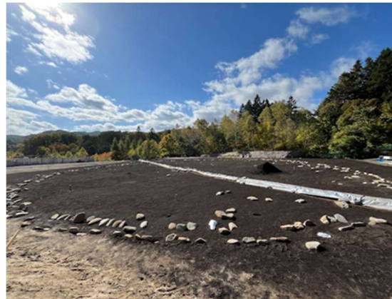
鷲ノ木遺跡ガイド養成講座（ストーンサークル）