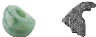
穴のあいた石と耳飾りの欠片

森町の遺跡では、勾玉のほかにも綺麗な色の石に穴をあけたものや切れ目のある石、ヒグマの骨に穴をあけたものも見つかっており、これらの道具はネックレスやプレスレット、ピアスなどのアクセサリーとして使われていたものと推測されます。