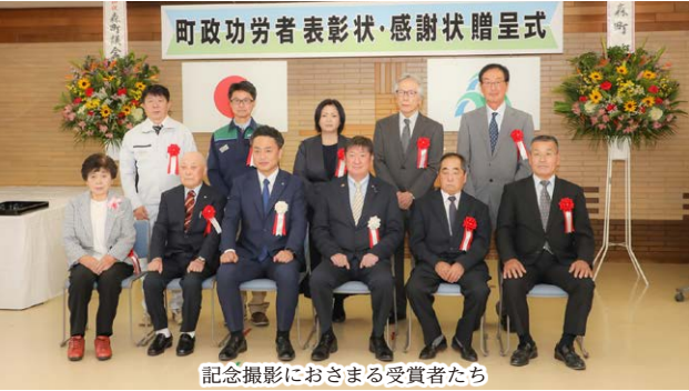
記念撮影におさまる受賞者たち