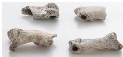
穴があいたヒグマの骨