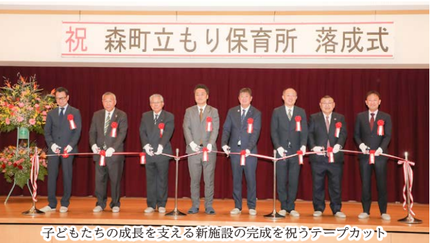
子どもたちの成長を支える新施設の完成を祝うテープカット