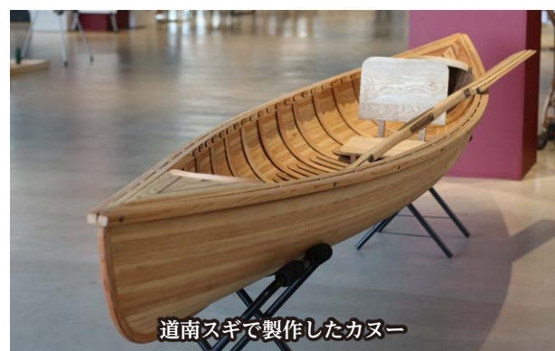
道南スギで製作したカヌー

森町では古くから炭づくりの原料として使われているようにミズナラが一定以上に分布しておりますが、そのミズナラがナラ枯れという伝染病により、枯死してしまう現象が発生しています。