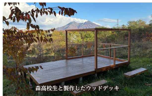
森高校生と製作したウッドデッキ