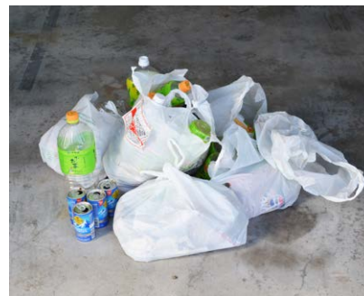
レジ袋に入れられて出されたごみ ※燃やせるごみ、ペットボトル、 空き缶などが混在している

また、外国人技能実習生の居住者が増えており、分別違反が増えていたとの相談も受けています。雇用主の皆さまは責任を持って、技能実習生に対してごみの分別方法や出し方をきちんと指導してくださいますようお願いいたします。