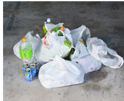
レジ袋に入れられて出されたごみ ※燃やせるごみ、ペットボトル、 空き缶などが混在している

また、外国人技能実習生の居住者が増えており、分別違反が増えていたとの相談も受けています。雇用主の皆さまは責任を持って、技能実習生に対してごみの分別方法や出し方をきちんと指導してくださいますようお願いいたします。