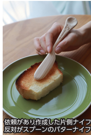
依頼があり作成した片側ナイフ、反対がスプーンのバターナイフ

さらに、Matsu Cafe と木育を掛け合わせたイベントや商品づくりにも力を入れ、「コーヒーを飲みながら木に触れる」「ものづくりを通して地域を知る」といった、森町ならではの体験づくりを進めていきます。今年度は、地域資源の魅力をより多くの方へ伝えながら、町内外をつなぐ活動へ発展させていきたいと思っています。