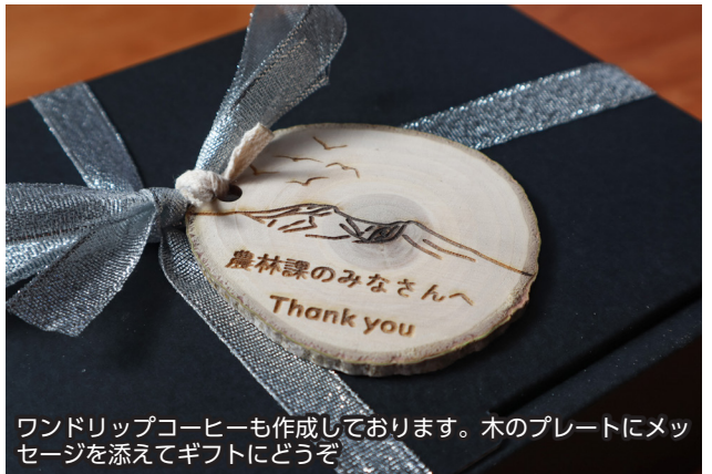
ワンドリップコーヒーも作成しております。木のプレートにメッセージを添えてギフトにどうぞ