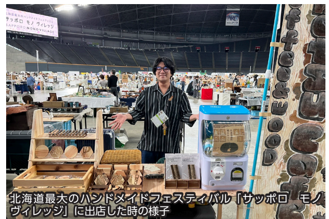
北海道最大のハンドメイドフェスティバル「サッポロモノウィレッジ」に出店した時の様子