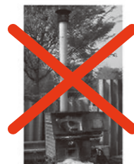
不適合炉による焼却