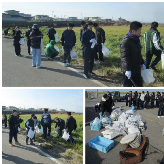
ポイ捨てごみを回収する砂原中生