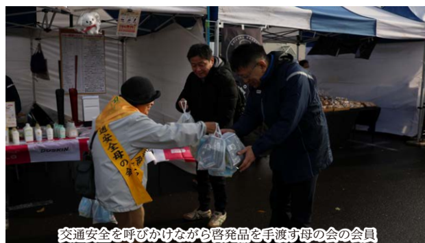
交通安全を呼びかけながら啓発品を手渡す母の会の会員

11月4日、町と明治安田生命保険相互会社は、町民の健康増進とサービス向上をめざし包括連携協定を締結しました。「地域の元気プロジェクト」により、健康づくりの推進や地域経済の活性化を目的としています。同社の理念を軸に地域資源をつなぎ、豊かな地域づくりを進めます。町長は「安心・安全が深まる」と感謝を述べました。また当日、「私の地元応援募金」の目録も贈呈されました。