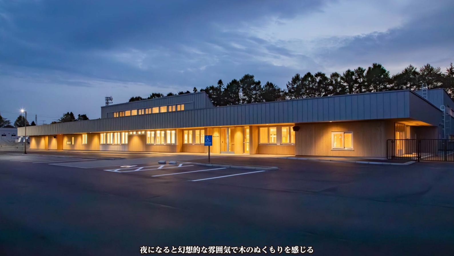
夜になると幻想的な雰囲気でも木のぬくもりを感じる