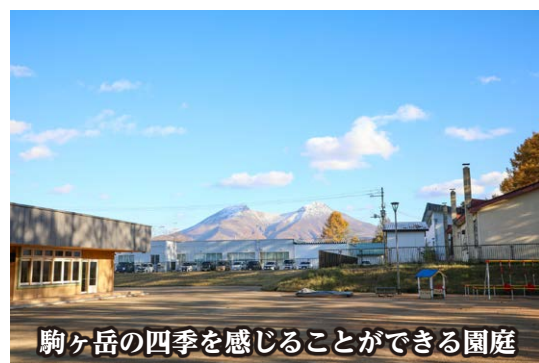
駒ヶ岳の四季を感じることができる園庭

最後に町民の皆様、議会議員の皆様、施工業者の皆様、役場関係部署職員のご理解・ご協力によりこの「もり保育所」を整備することができました。この場をお借りして感謝申し上げます。本当にありがとうございます。