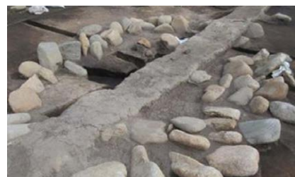
中央配石の調査風景