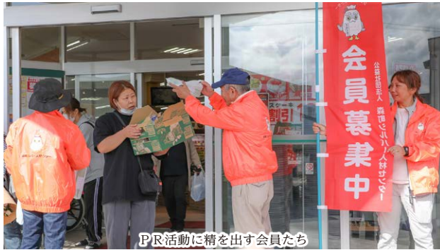
PR活動に精を出す会員たち