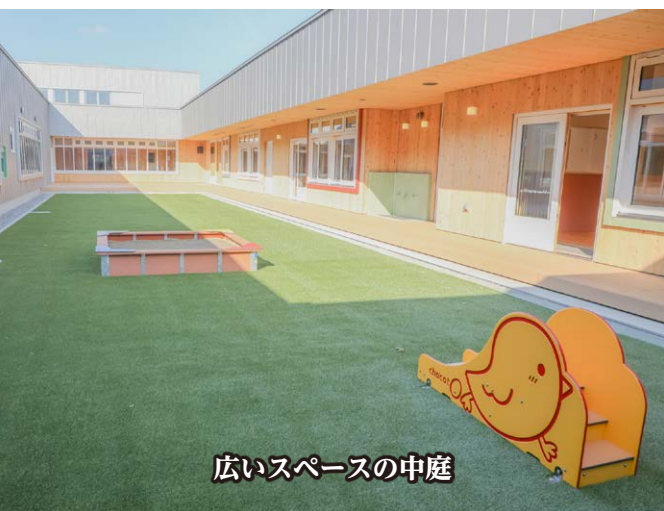
広いスペースの中庭

A 保育所整備を進めるにあたり、保護者の皆様の考え方、保育士を含めた役場内部での考え方、設計者の考え方は多種多様となります。その考え方を整理し、形にしていくなめの時間や労力については相