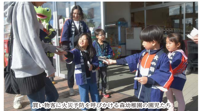
買い物客に火災予防を呼びかける森幼稚園の園児たち

発生時の連携体制や動きを確認しながら、防護服の着脱を実践しました。二重に着込む厳重な装備で、現場の緊張感を体験。感染源を断ち、伝染病の拡大を防ぐための大切な訓練となりました。