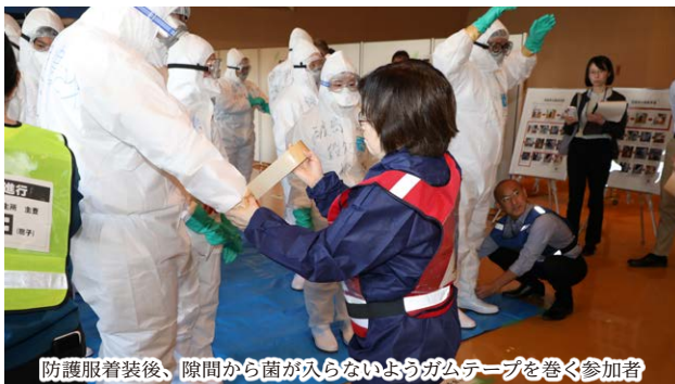
防護服装着後、隙間から菌が入らないようガムテープを巻く参加者

町では、環境にやさしい持続可能な社会を目指し、新エネルギーの普及啓発に取り組んでいます。10月10日には森小学校5年生が広報車「エネゴン」で発電体験を行い、21日には砂原中学校2年生が地熱・太陽光発電所を見学しました。児童生徒は体験を通じて、自然の力を生かすエネルギーの大切さを学びました。新エネルギーツアーは個人や団体でも参加できます。希望の方は企画振興課まで。