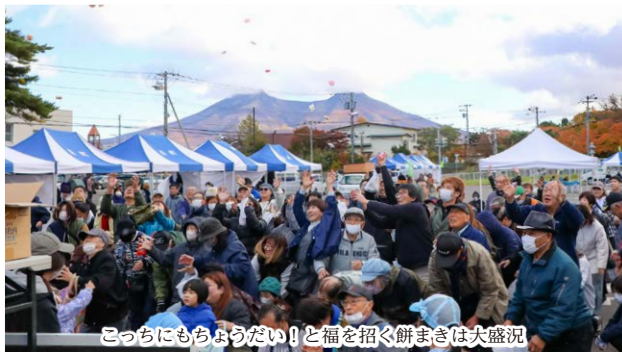
こっちにもちようだい!と福を招く餅まきは大盛況