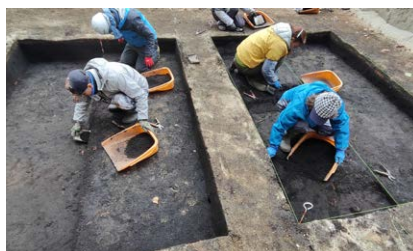
今年の発掘調査風景

詳細を報告する場合は別の機会に設けたいと思いますが、詳しい成果を知りたい方は森町教育委員会社会教育課文化財保護係までお気軽にお問い合わせください。