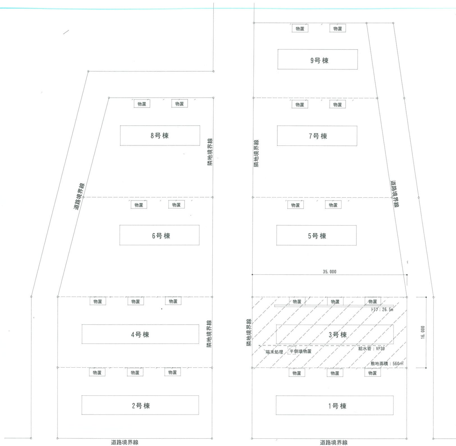
配置図 S : 1/500