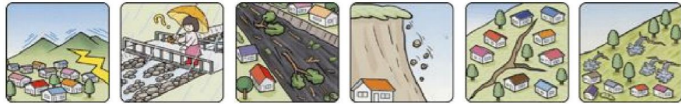
山鳴りがする 雨が降り続けているのに川の水位が下がる 川の流れが濁り流水が混ざりはじめる 小石がバラバラ落ちてくる 地面にひび割れができる 斜面から水がふき出す

次のような現象を察知した場合は、土砂災害が直後に起こる可能性があります。直ちに周りの人と安全な場所へ避難するとともに、関係機関へ通報してください。