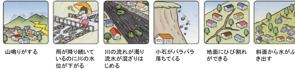
山鳴りがする 雨が降り続けているのに川の水位が下がる 川の流れが濁り流水が混ざりはじめる 小石がバラバラ落ちてくる 地面にひび割れができる 斜面から水がふき出す

次のような現象を察知した場合は、土砂災害が直後に起こる可能性があります。直ちに周りの人と安全な場所へ避難するとともに、関係機関へ通報してください。