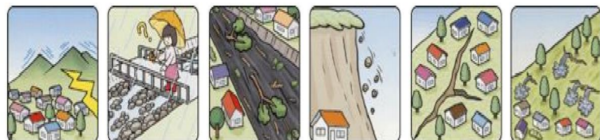
山鳴りがする 雨が降り続けているのに川の水位が下がる 川の流が濁り流水が混ざりはじめる 小石がバラバラ落ちてくる 地面にひび割れができる 斜面から水がふき出す

土砂災害に注意して 早めの避難! こんな前ぶれ現象に注意! 次のような現象を察知した場合は、土砂災害が直後に起こる可能性があります。直ちに周りの人と安全な場所へ避難するとともに、関係機関へ通報してください。